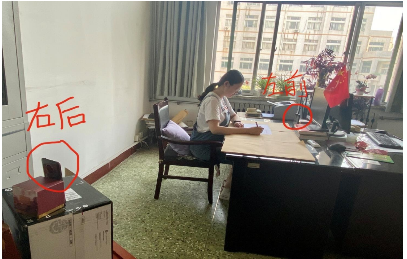
考生左侧拍到的全景图