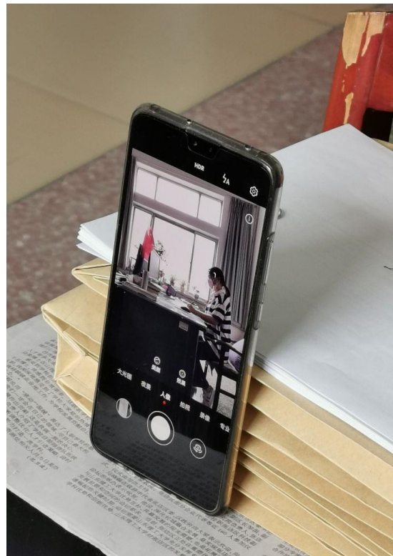
腾讯会议视频效果截图：